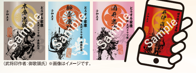
(武将印作者: 御歌頭氏) ※画像はイメージです。

愛知、静岡、岐阜の歴史・武将観光施設(全10か所)を訪問し、 設置されたQRコードを読み込んでデジタル武将印をゲット! ※獲得できるデジタル武将印については、チラシ裏面をご確認ください。 ※一部施設はデジタル武将印の取得に入場料が必要となります。 最新の情報は専用サイトをご確認ください。