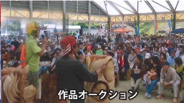
作品オークション