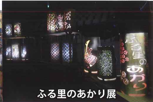
ふる里のあかり展

・チェーンソーアート体験 ・地元特産品販売 ・お楽しみステージなどなど各種イベントもお楽しみに!!