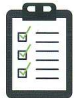
体調チェック表の記入