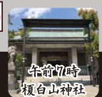
午前7時 額白山神社