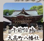
午前10時 大高町八幡社