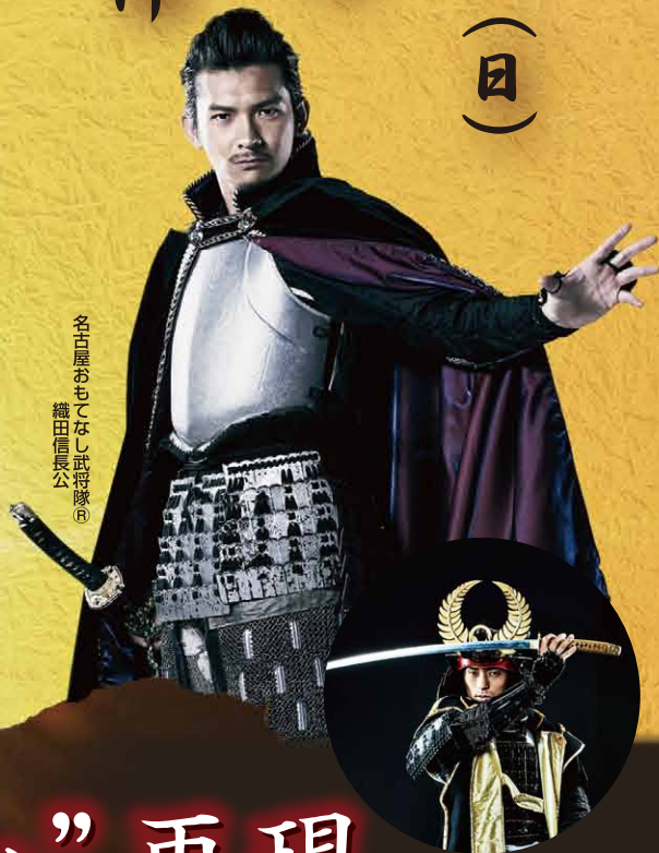
名古屋おもてなし武将隊® 織田信長公