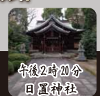
午後2時20分 日置神社