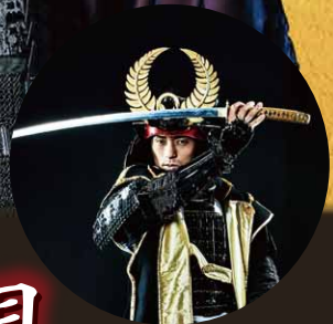
今回は徳川家康公 前田利家殿も登場