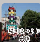
6/3 城川まつり 出陣