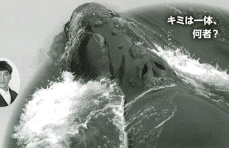
ミナミセメクジラ