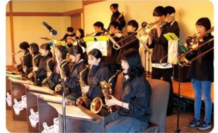
中部楽器技術専門学校吹奏楽部