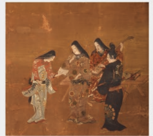
重要文化財 本多平八郎姿絵屏風(部分) 徳川美術館蔵