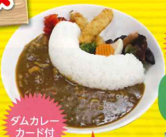
ダムカレー カード付