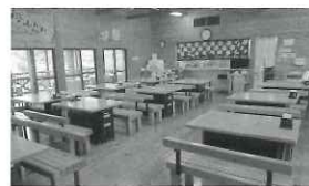
▲お食事は広々としたテーブル席で!

雪そり遊びを満喫したらお腹は空くもの…。 レストランげんき亭(72席)で、温かな美味しいお食事をどうぞ。