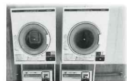
▲濡れてしまった服も乾かせます!