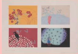
杉浦非水『非水図案集』第一集