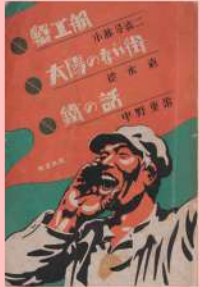
柳瀬正夢『蟹工船/太陽のない街/鐵の話』