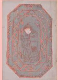
岸田劉生『白樺』第12年5月号