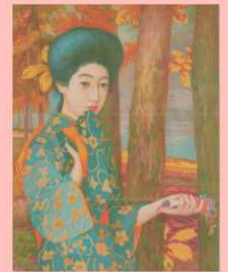
橋口五葉『龍膽』『新小説』第2巻第3号口絵