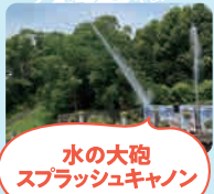
水の大砲 スプラッシュキャンボン