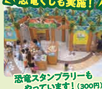
恐竜スタンプラリーも やっています!(300円)