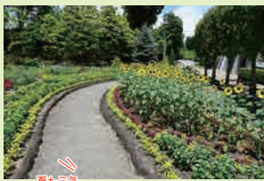
夏も元気いっぱい!! 夏の一年草花壇