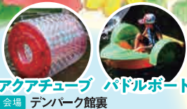
アクアチューブ パドルボート 会場 デンパーク館裏