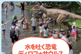
水を吐く恐竜 ディロフォサウルス