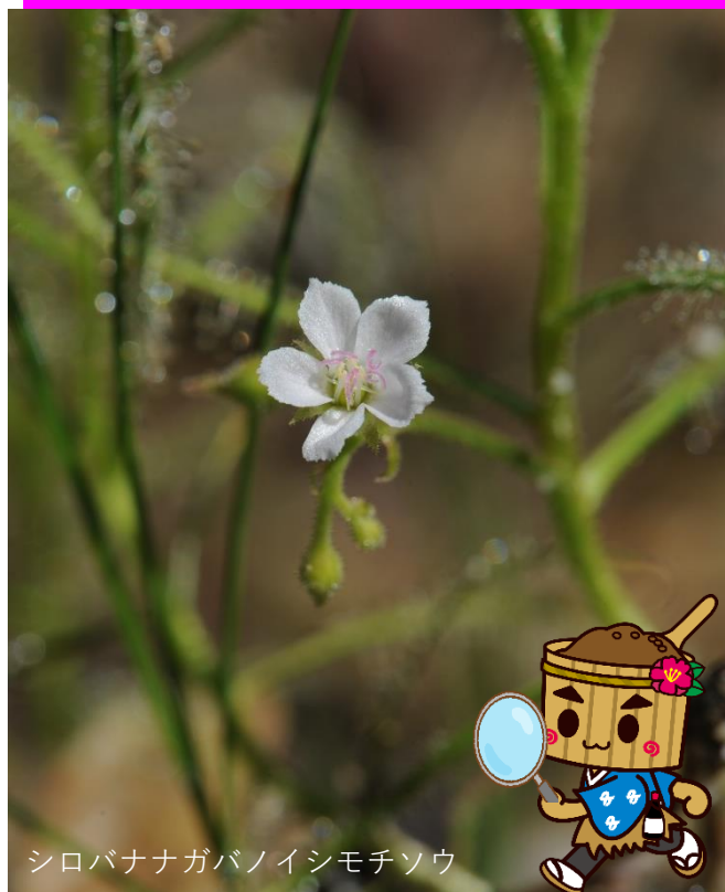
シロバナナガバノイシモチソウ