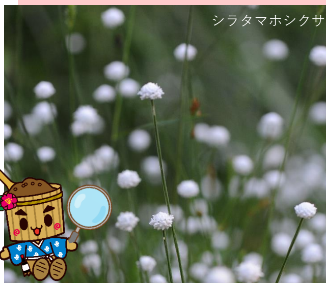
シラタマホシクサ