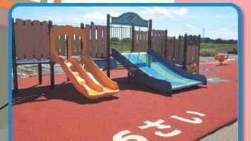
幼児用遊具 (幅広すべり台)