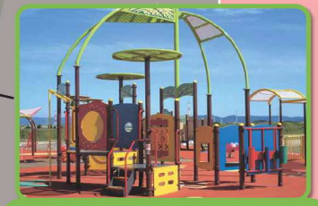
幼児用複合遊具 (音の出る遊具)

ぶらリン広場は、令和3年12月1日に供用開始しました。 遊具について ネット式ブランコや音の出る遊具など、誰もが一緒に遊べる遊具です。 今回利用開始面積 約0.5ha