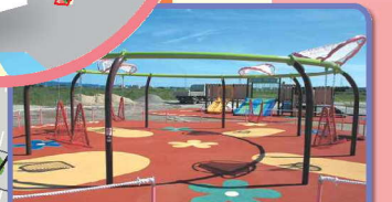
幼児用遊具 (ネット式ブランコ)