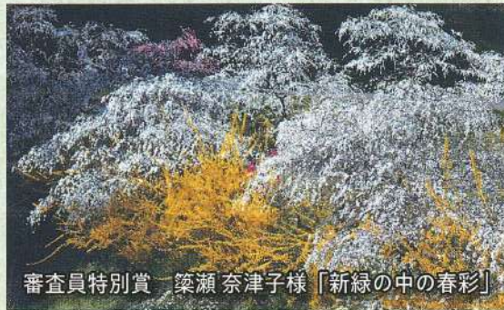
審査員特別賞 築瀬 奈津子様「新緑の中の春彩」