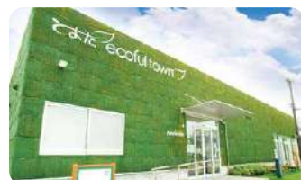
とよたエコフルタウン