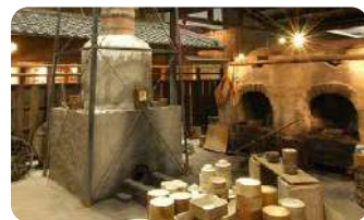
瀬戸蔵ミュージアム