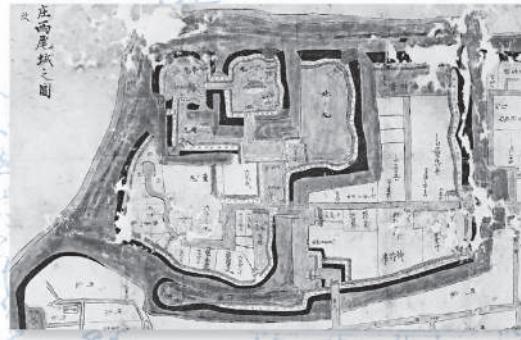
三州幡豆郡吉良庄 西尾城之図(部分) 個人蔵