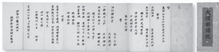
長圓寺檀那板倉勝澄請疏 長圓寺文書

※オモテ面上部は「八面山の存興」、下部は「須田先益之夕景」、ウラ面背景は「祇園会御旅所」。すべて「西尾八景」(岩瀬文庫蔵、[49-89])より。