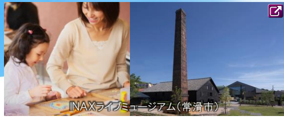
INAXライブミュージアム(常滑市)