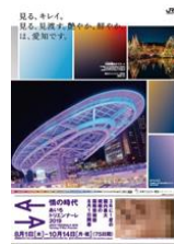
夜観光・都市観光