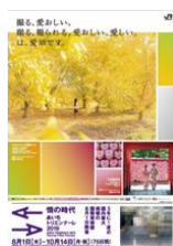
フォトジェニック

昨年実施した愛知DCフォトコンテストの入賞作品などを用いた、愛知県大型観光キャンペーン実施協議会制作の5枚組ポスターを8月に全国のJRの主な駅に掲出。