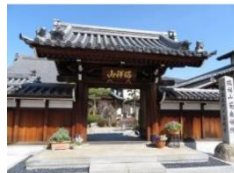
菊泉院（福島正則公の菩提寺）