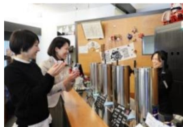
ほうらいせん吟醸工房