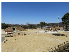
豊川海軍工廠平和公園