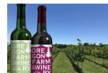
オレゴンファーム&ワイナリー