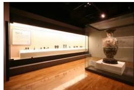
あま市七宝焼アートヴィレッジ