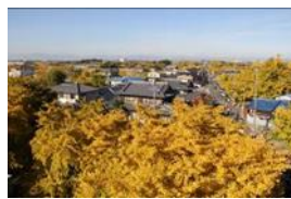
そぶえイチョウ黄葉まつり