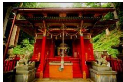
鳳来山東照宮御宮殿