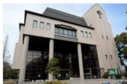
名古屋市秀吉清正記念館