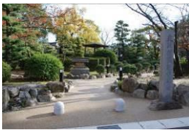
桶狭間古戦場伝説地