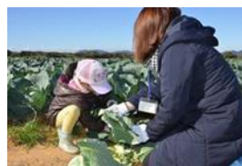
キャベツ収穫体験