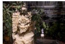
トロピカルフルーツのジャングル探検