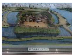
勝幡城推定復元模型