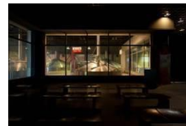
キンビール名古屋工場