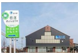
道の駅 田原めっくんはうす