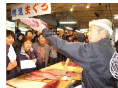
味のヤマスイ 山本水産