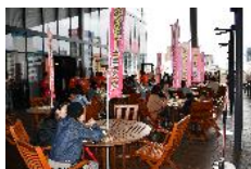
モーニングカフェイベント