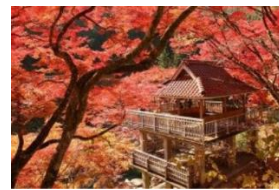
大井平公園と中馬街道・稲武宿散策