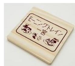
ヘッドマークロゴ入り コースター (お一人様1個限り)

※周遊バスの詳細は三重交通株式会社 観光販売システム営業部 (Tel052-253-6324)へお問合せください。