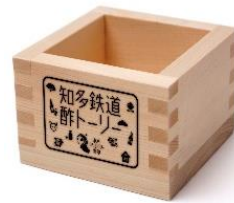
ヘッドマークロゴ入り升 (お一人様1個限り)