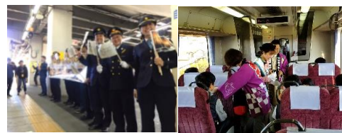
昨年度の駅・車内のおもてなしの様子

※各列車とも全車指定席の快速列車です。ご利用には乗車券の他に指定席券が必要です。