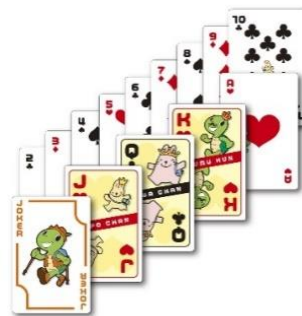
2 ビンゴ（2列スタンプを集めた方） オリジナルトランプ ※お一人様1個限り （先着 3,000 名様）