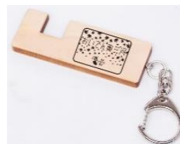
ヘッドマークロゴ入り スマホスタンドキーホルダー (お一人様1個限り)

※上記観光列車の運行情報は、Japan Highlights Travel のHP( https://japan-highlights-travel.com/jp/ )でもご案内します。 ※上記全てのツアー詳細は、各旅行会社のパンフレットなどをご確認ください。また、ジェイアール東海ツアーズの商品については、JR東海「50+」の商品となります。