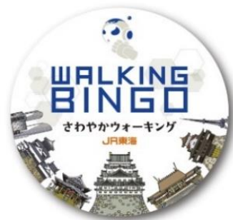
1 ビンゴ（1列スタンプを集めた方） オリジナル缶バッジ ※お一人様1個限り （先着 8,000 名様）