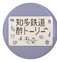
ヘッドマークロゴ入り缶バッジ (例)