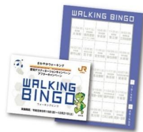
ウォーキングビンゴカード

※ウォーキングビンゴカードは無くなり次第配布終了となります。（お一人様1枚限り）