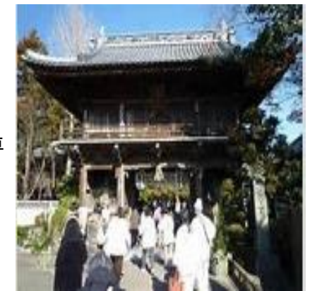
四国霊場めぐりの様子