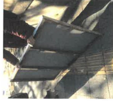
▲既存パネルの背面