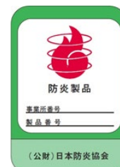
[防災製品ラベルの例]