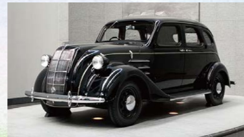
▲写真はトヨタAA型乗用車(レプリカ)

〒名古屋市港区港町1-3 [MAP:名古屋市拡大図] 交 伊勢湾岸道「名港中央」ICより約9km 問 ☎052-654-7080 (名古屋港水族館)