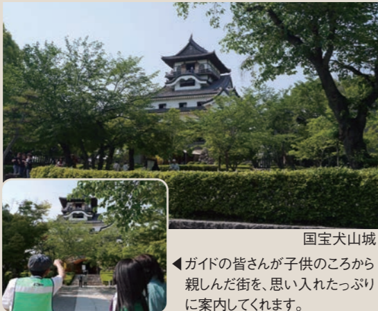
国宝犬山城 ガイドの皆さんが子供のころから親しんだ街を、思い入れたっぷりに案内してくれます。

国宝犬山城は、創建当時のまま現存する日本唯一の天守閣。それはつまり、歴史上の英雄達が立った床板が残っているということです！城下町の道幅も江戸時代のまま。何度訪れても新しい驚きがあると好評とのこと。ボランティアガイドさん達はみんな好奇心旺盛な犬山市民育ち。生まれる前から大きく変わらない、歴史ロマンあふれる街を個性豊かに詳しく案内してくれます。お耳の不自由な方でも対応できる「手話ガイド」もいらっしゃる、県内でも数少ない団体です。