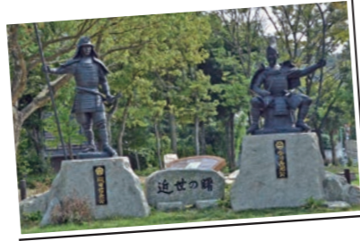
桶狭間古戦場公園 (名古屋市)

19年3月桶狭間古戦場観光案内所オープン (名古屋市緑区) 桶狭間の戦いに関するパネル展示や史跡ガイドお取次ぎ等をしています。 時間:10:00~16:00 桶狭間古戦場保存会 090-7861-8413