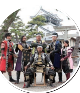
グレート家康公「葵」武将隊