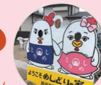
▲めんどりくん・めんどりちゃん になって記念写真はいかが?