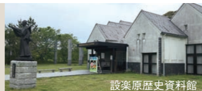
設楽原歴史資料館

長篠設楽原合戦の鎮魂の祭り「火おんどり」は、資料館近くの信玄塚で毎年8月15日に開催