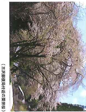
(三沢郵便局付近の栗世桜)

見頃：4月中旬～下旬 国道151号線沿い・八幡神社境内「道の駅」周辺から、茶田山高原方面へ約5分の所にある、川宇連神社付近の桜もドライブする人々の目を惹きつけてくれるはずです。