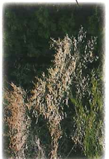
アドベント とよね