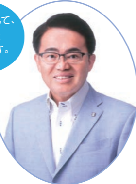
愛知県知事 大村 秀章 (愛知県大型観光キャンペーン実施協議会会長)