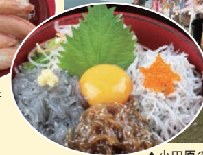
▲小田原のしらすぶっかけ丼