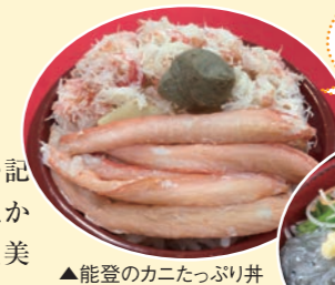
▲能登のカニたっぷり丼