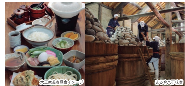
大正庵釜春昼食イメージ

問い合わせ先/052-253-6324(観光販売システムズ) 運行時期/10月7日(日)、8日(月祝)、14日(日)、15日(月)、20日(日)、22日(月)、27日(日) 11月3日(土)、4日(日)、10日(土)、11日(日)、17日(土)、18日(日)、25日(日)、26日(月) 12月1日(土)、2日(日)、8日(土)、9日(日)、10日(月)、15日(土)、16日(日)、23日(日)、24日(月祝) 旅行代金/大人・小人3,000円 料金に含まれるもの/バス代、岡崎歴史かたり人案内料、岡崎城下家康公お城クーポン、大樹寺宝物殿、大正庵釜春昼食 ガイド・同行/岡崎歴史かたり人1名 所要時間/7時間35分 行程/JR岡崎駅(9:00)出発…名鉄東岡崎駅(9:25)出発…六所神社(見学)…岡崎城(入館)・グレート演武見学・岡崎公園(見学)~自由散策~三河武士のやかた家康館(各自支払い)観光みやげ店(岡崎土産300円券付・家康公クーポン利用)…大正庵釜春(昼食)…大樹寺(宝物殿拝観)…八丁味噌の蔵(見学、味噌土産付)…名鉄東岡崎駅(16:15)着…JR岡崎駅(16:35)着