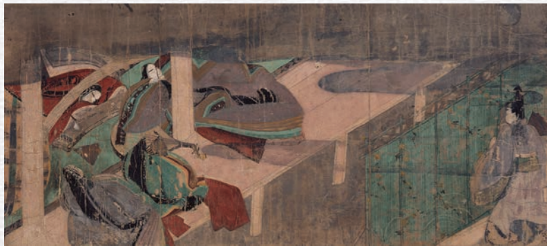
国宝「源氏物語絵巻」橋姫(徳川美術館蔵)

名古屋市 徳川美術館 特別展 源氏物語の世界 - 王朝の恋物語 - ◆期間:11月3日(土・祝)～12月16日(日) ※休館日除く