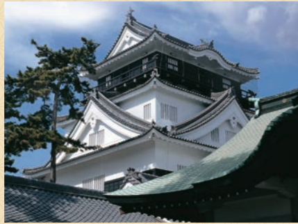
岡崎城公園内に建つ徳川家康像

岡崎城の起源は15世紀前半まで遡ります。明大寺の地に西郷頼嗣(頼頼)によって築城されたのがそのはじまりです。その後、享禄4年(1531)に松平清康(家康公の祖父)が現在の位置に移して以来、ここが岡崎城と称されるようになりました。天文11年(1542)12月26日、徳川家康公は、ここ岡崎城内で誕生しました。戦国時代の荒波を、家臣団との絆と知略で切り抜け、ついに天下統一を成し遂げたその足がかりがこの岡崎城です。