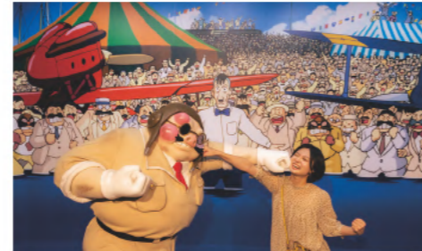
④ポルコがカーチェスと決闘する「紅の豚」のクライマックス

「紅の豚」「崖の上のポニョ」「天空の城ラピュタ」など、13作品から14のシーンをフィーチャー。各シーンを思い浮かべながら、登場人物になりきって撮影するのが楽しい!