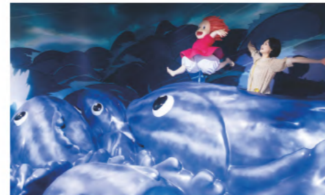
④ポニョと一緒に、大きな波に乗って駆ける躍動感が楽しい