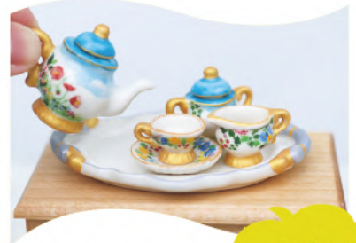
ミニチュア 食器づくり

豊橋市の動物園で、普段は見られないバックヤードや生物多様性の世界をセグウェイで案内!