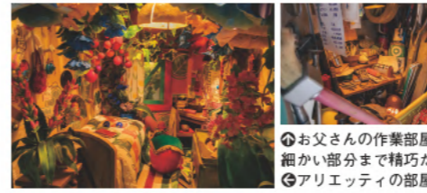
④お父さんの作業部屋。細かい部分まで精巧だ ④アリエッティの部屋

「借りぐらしのアリエッティ」で描かれる、小人目線の世界。小人の視線で見える身近な日用品や、庭に茂る巨大な草花にドキドキ!