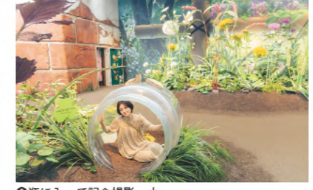
④瓶に入って記念撮影。小人になった気分を楽しもう