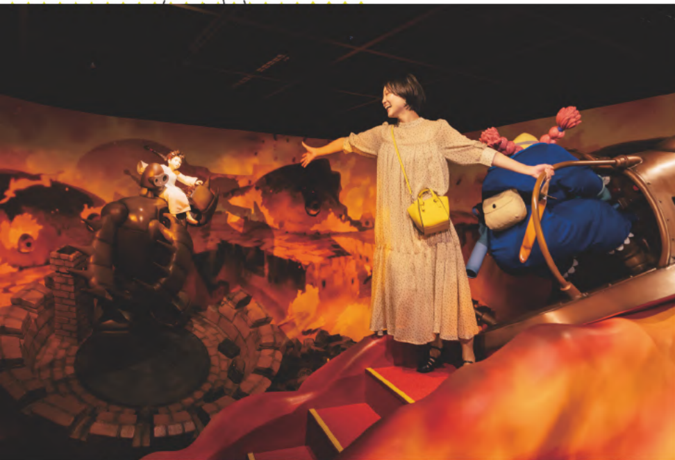
④「天空の城ラピュタ」のバズーになりきる。フラップターを操るドーラの後ろで、シータへ手を伸ばそう

愛・地球博記念公園(モリコロパーク)に広がる森や既存の建物と調和しながら、ジブリ作品の世界を表現した公園施設「ジブリパーク」。第1期として「ジブリの大倉庫」「青春の丘」「どんどこ森」が開園している。風に誘われて気の向くままに公園内を歩けば、思わぬ所に楽しい発見があるかも!?