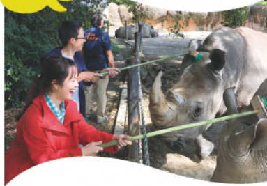
のんはいパーク バックヤード ツアー

豊橋市の動物園で、普段は見られないバックヤードや生物多様性の世界をセグウェイで案内!