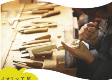
バイオリン工房 見学 & 製作体験

名古屋市隣の大府市で製造現場の見学に加え、バイオリンに使われる、駒という部位にニスを塗る作業を体験