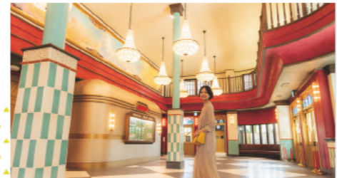
④④「ジブリの大倉庫」入場時にもらえる鑑賞券を手に入れたら、④海外の劇場のような空間が広がるハワイエの雰囲気も素敵