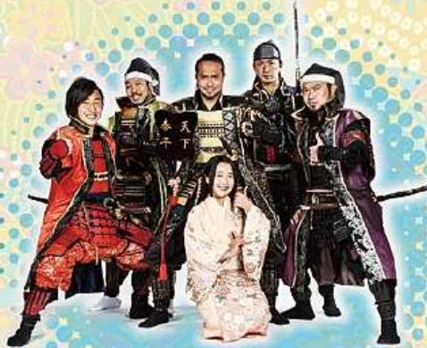
グレート家康公「葵」武将隊