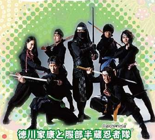
徳川家康と服部半蔵忍者隊