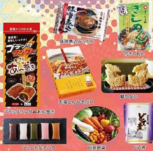
味噌煮込みうどん