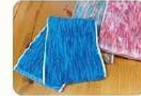
かすり染めタオル