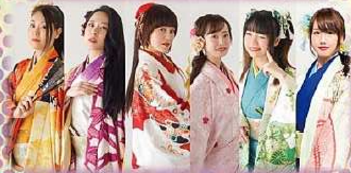
PRINCESS SAMURAI of JAPAN あいち戦国姫隊