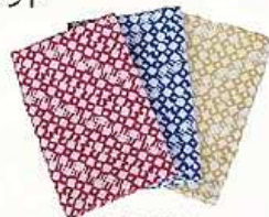
三河木綿手ぬぐい